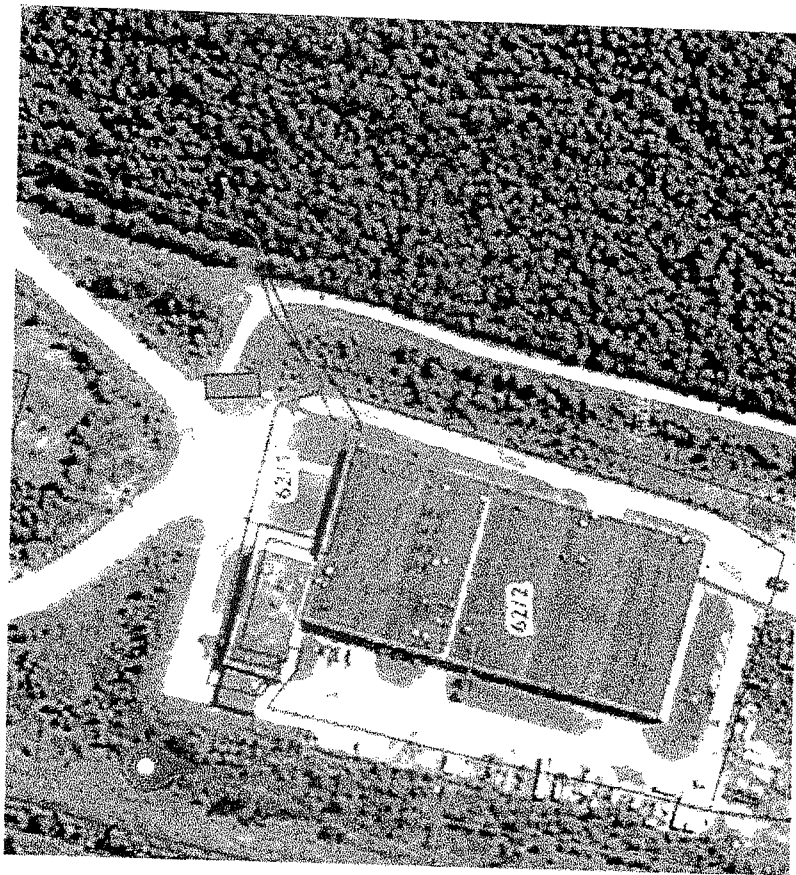
Место (площадка) накопления ТКО

г. Железнодорож-Илимский, п. Донецкого ЛПХ, район здания 34